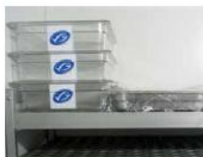
保持经 MSC 认证的鱼与其它鱼分开，