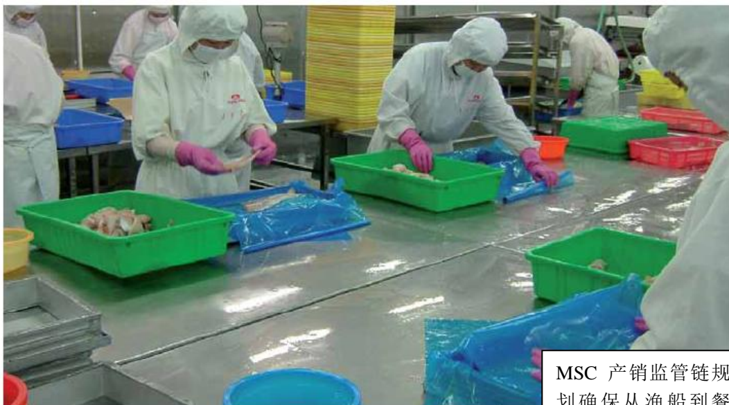
MSC 产销监管链规划确保从渔船到餐盘的可追溯性