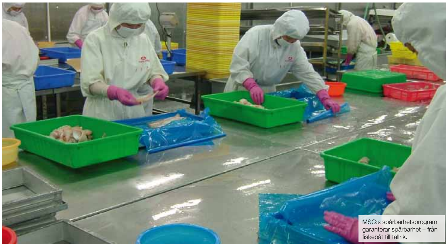
MSC:s spårbarhetsprogram garanterar spårbarhet – från fiskebåt till tallrik.