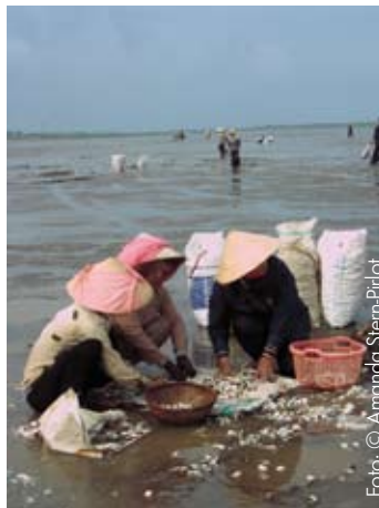
Musselplockning i Vietnam