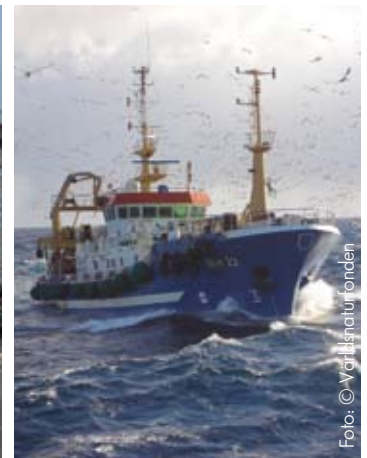
Kummelträning utanför Sydafrikas kust