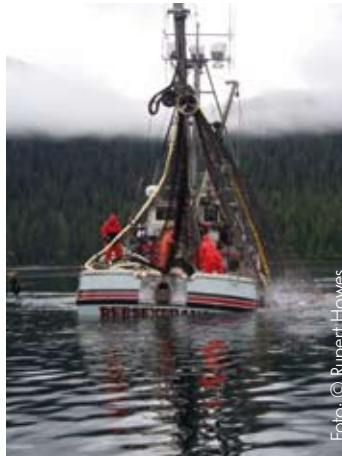
Laxfiske nära Sitka i Alaska

MSC:s miljömärkning gör det enkelt för konsumenten att upptäcka hållbara fiskprodukter. Symbolen visar att fisken kommer från ett ansvarsfullt fiske. Genom att välja MSC-märkt fisk visar konsumenten sitt stöd för ett välskött och uthålligt fiske och sänder ett positivt meddelande tillbaka till fiskaren.