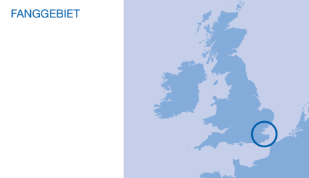
Themsemündung, bis zum sechs-Meilen-Limit

FANGVOLUMEN 2 Tonnen (Anlandungen 2006/07)