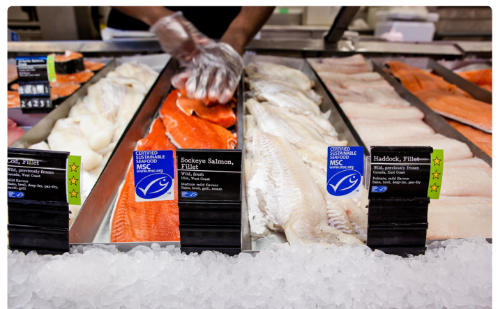
Loblaw Companies Limited, Canada

Med hjälp av MSC:s miljömärke kan inköpare, beredningsföretag, grossister, detaljhandel och storköksföretag visa sina kunder att de köper fisk och skaldjur som kommer från ett certifierat hållbart fiske.