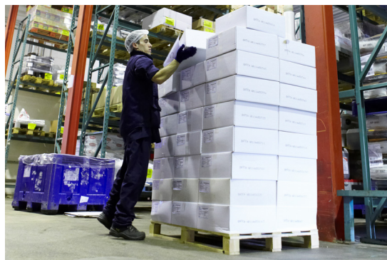
MSC-certifierat lager

Skriftliga avtal är inte längre ett krav för underleverantörer som anlitas för lager/förvaring, förutsatt att andra krav uppfylls.