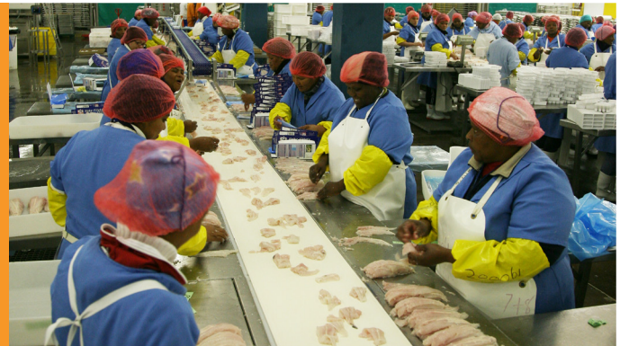
Beredning av sydafrikansk kummel / © Sea Harvest