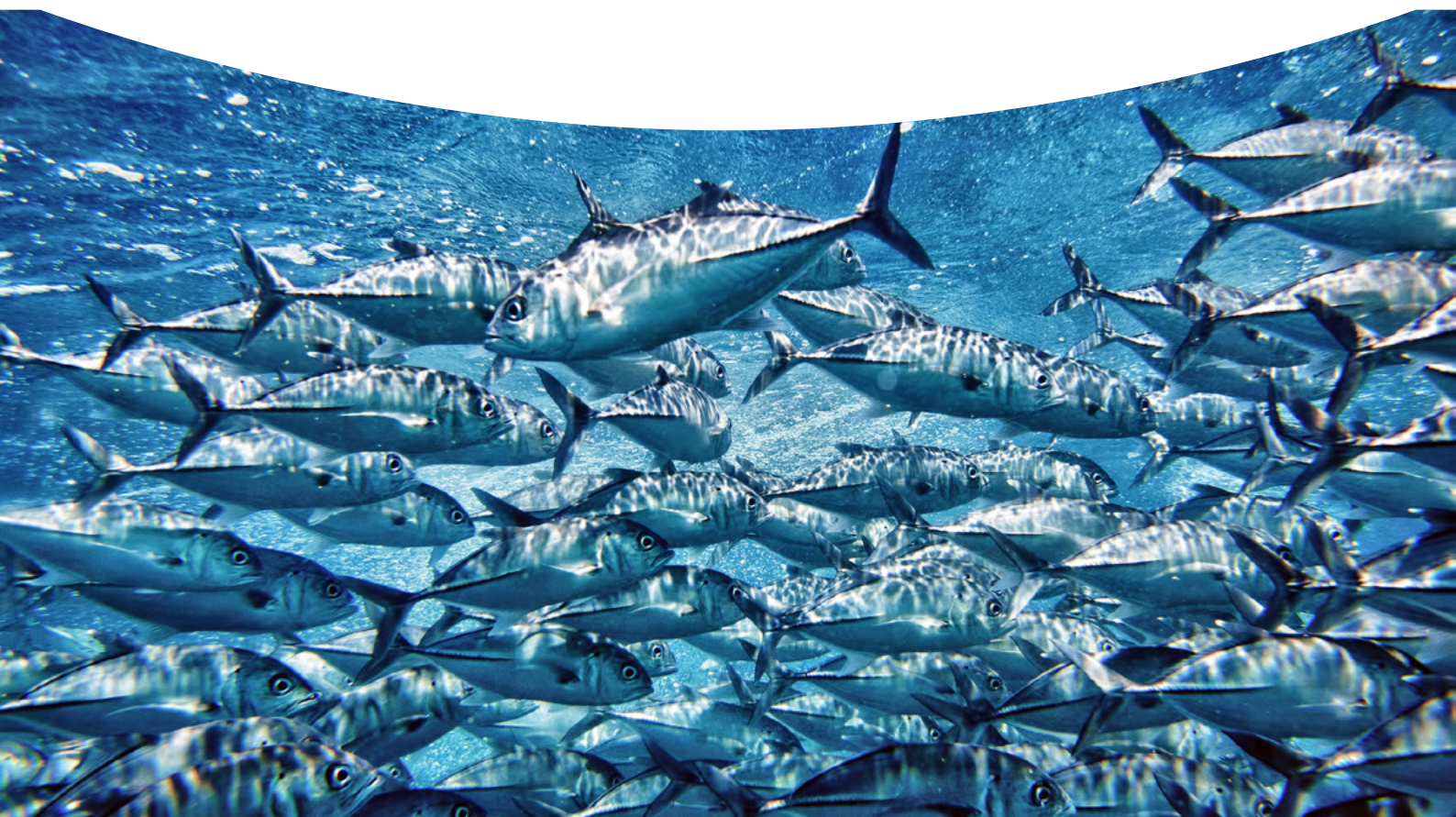
Tableau 1 : pêcheries de thons engagées dans le programme du MSC en France