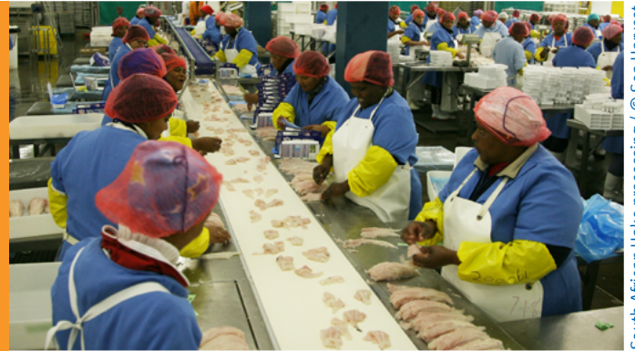
South African Hake processing